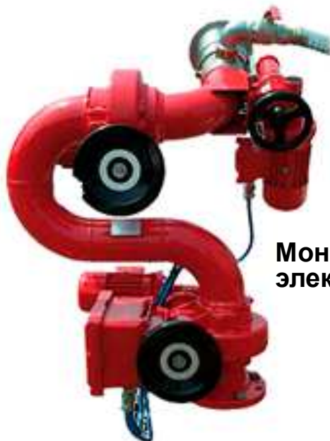
Монитор с дистанционным электроуправлением